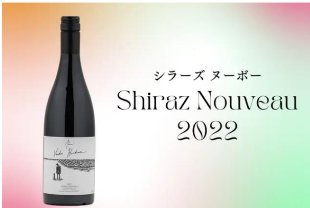
シラーズ ニューボー Shiraz Nouveau 2022

軽やかで爽やか、真っ赤な果実のニュアンスと程よいタンニンが調和した、新感覚の香り高いシラーズで、冷やしても美味しく飲みやすいワイン。